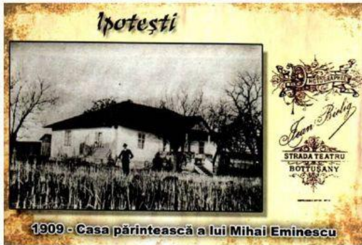
Fotografie cu casa familiei Eminovici, în 1909